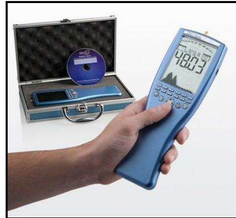
נתוני מכשיר אארוניה:

מכשיר מדויק בעל רגישות גבוהה, טווח מדידה רחב ויכולת לאגור נתונים.